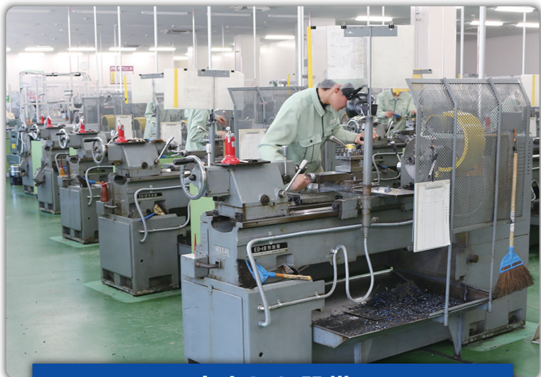
— 充実した設備 —